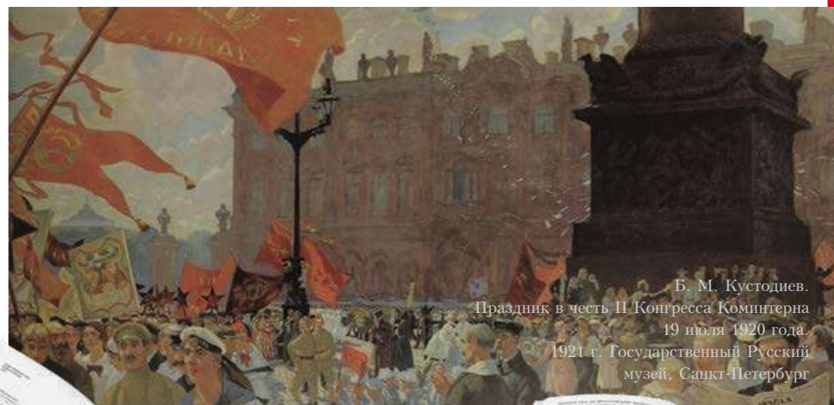
Б. М. Кустодиев. Праздник в честь II Конгресса Коминтерна 19 июля 1920 года. 1921 г. Государственный Русский музей, Санкт-Петербург