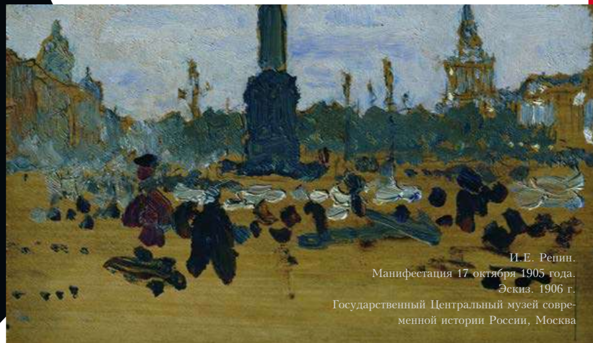
И. Е. Репин. Манифестация 17 октября 1905 года. Эскиз. 1906 г. Государственный Центральный музей современной истории России, Москва

Автор поставил своей целью наконец-то отделить революционное искусство от искусства раннесоветского, насквозь пропитанного уже иной сталинской идеологией и культурой. Странно, но по сей день этого никто так и не сделал: крупнейшие музеи России и мира продол-