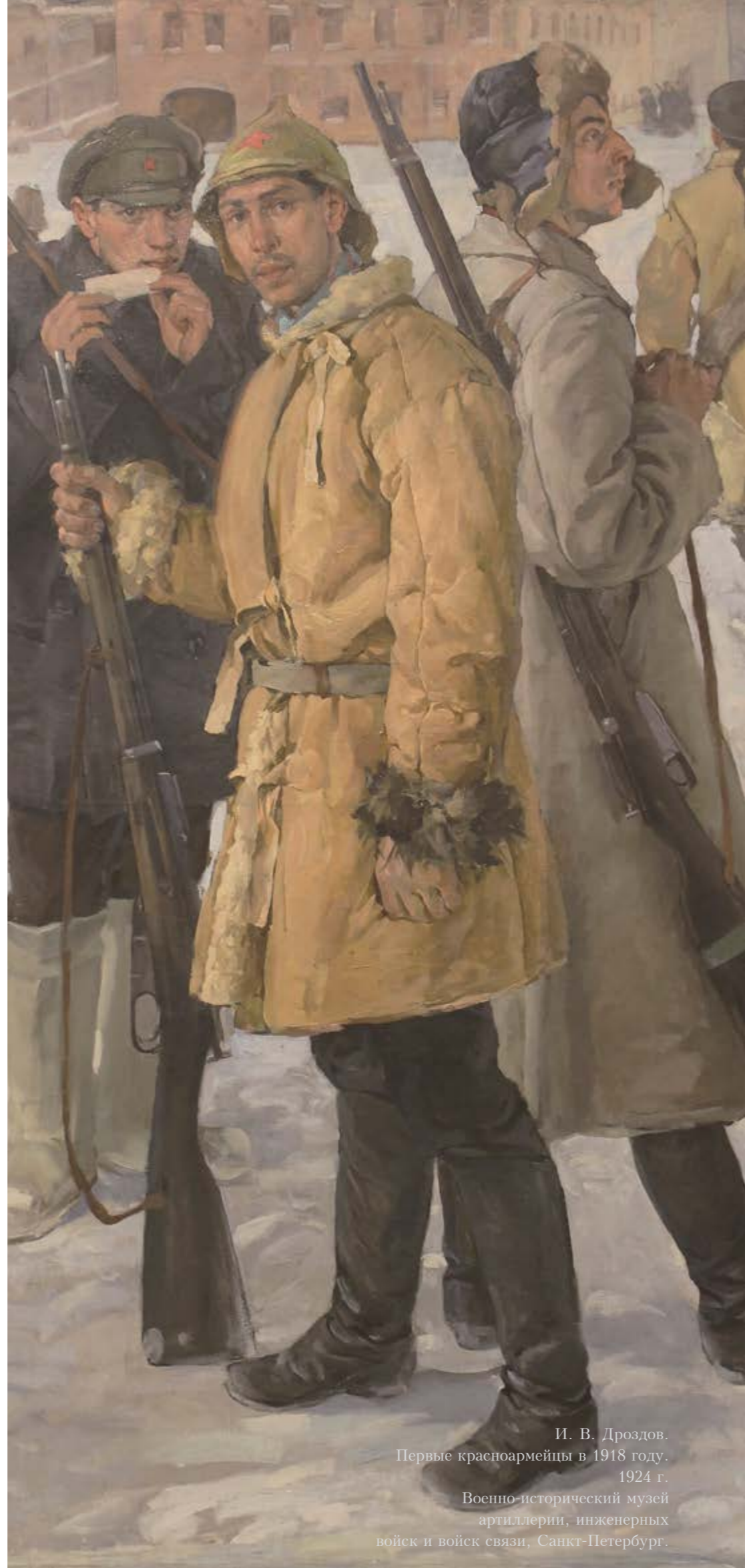
И. В. Дроздов. Первые красноармейцы в 1918 году. 1924 г. Военно-исторический музей артиллерии, инженерных войск и войск связи, Санкт-Петербург.